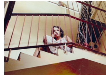
„Isabel auf der Treppe“

Gesprächspartnerin: Evelyn Schmidt Einführung und Moderation: Paul Werner Wagner