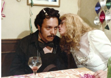
„Blonder Tango“