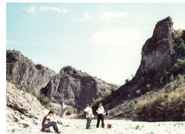
„Der Übergang“, © DEFA-Stiftung/ Heinz Pufahl

schlupf bei einer Bäuerin, da Juan Hilfe braucht. Seine Wunden, die ihm bei der Folter im Gefängnis beigebracht wurden, sind aufgebrochen. In der Bäuerin erkennen sie die Frau des ermordeten Viehzüchters. Sie ist hochschwanger, und die drei bleiben, um ihr bei der Entbindung zu helfen. Als sie endlich die Grenze passiert haben, wird ihr Asylantrag abgelehnt. Juan flieht, die beiden anderen werden gefesselt zurückgebracht. Ein Befreiungsversuch Juans misslingt zwar, aber die Gefangenen können einen Posten töten und seine Maschinenpistole in ihren Besitz bringen. Sie sind entschlossen, sich zu verteidigen.